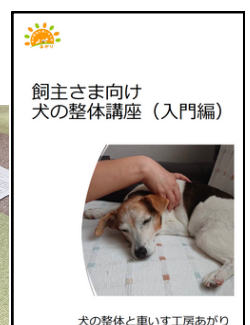
飼い主さま向け 犬の整体講座（入門編）